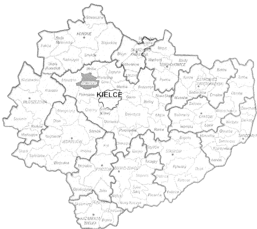
Położenie gminy Strawczyn w województwie świętokrzyskim

Miejscowość jest zwodociągowana, posiada sieć telefoniczną, oświetlenie uliczne i dostateczny stan dróg.